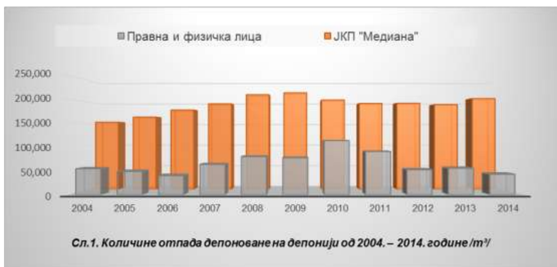
Таб. 4 Састав и количина депонованог отпада на депонији у 2014. години