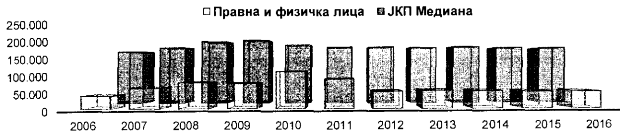
Таб.2 Количине отпада одлагане на депонији у периоду од 2006. до 2016.год. -m 3