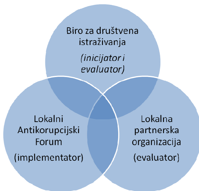
Схема 1. Актери у процесу креирања, реализације, мониторинга и евалуације Локалног плана за борбу против корупције

општинама, као и да изврши рангирање градова и општина које су овај документ почеле да примењују. Наиме, предмет мерења ће бити остварени напредак сваког града у остваривању Локалног плана за борбу против корупције. Извештајем би се пратиле три врсте индикатора: индикатори примене, индикатори резултата и индикатори контекста. Као извори за оцену ће бити коришћени подаци које поседује ЛАФ, као и подаци које ће Биро за друштвена истраживања прикупити током за ту сврху организованог истраживања.