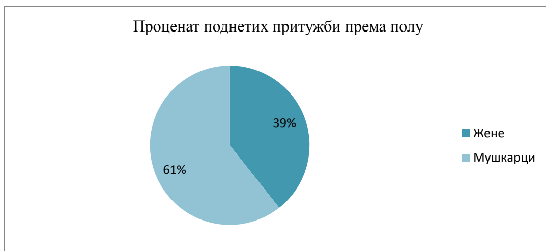
Табела 2 – Начин подношења притужбе Заштитнику грађана у 2019.години

Приказ поднетих притужби према органу на чији су се рад грађани жалили у 2019.години је приказан у табели број 3.