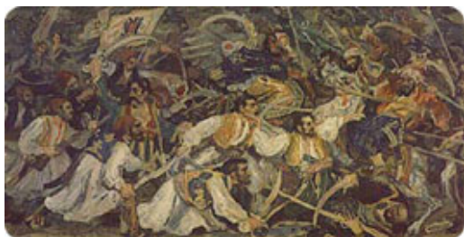
Бој на Чегру