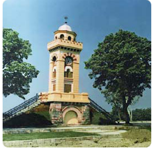
Споменик на Чегру

Прво обележје места на коме је била Чегарска битка подигнуто је 4. јула 1878. године са натписом: “Војводи Стевану Синђелићу и његовим неумрлим јунацима, који овде славно изгибоше 19. маја 1809. године нападајући Ниш. Књаз Милан М. Обреновић IV и његова храбра војска покајаше их 29. децембра 1877. године освојивши Ниш.” Данашњи споменик у облику куле – симбола војног утврђења – подигнут је поводом педесетогодишњице ослобођења Ниша од Турака 1. јуна 1927. године. У полукружној ниши споменика на Чегру постављено је 1938. године бронзано попрсије Стевана Синђелића.