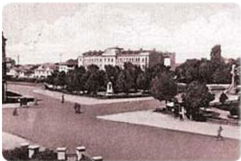
Ниш по ослобођењу од Турака

За време кнеза Милоша и кнеза Михајла јужни делови Србије остају под Турцима. 11. јануара 1878. године после дугих борби кнез Милан је ушао у нишку Тврђаву. Од тог времена Ниш престаје да буде оријентална касаба и долази до наглог развоја. Град се изграђује и унапређује културно и политички. Ниш постаје друга престоница у Србији. 1878. године добија гимназију, 1882. године учитељску школу, а 1894. године вишу девојачку школу. Ниш је 1895. године имао три основне школе за дечаке и једну за девојчице.