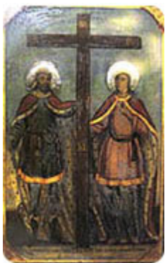
Стефан Немања и Свети Сава

О настанку Ниша постоји предање да га је саградио краљевић Ниша каменом с оближње хумске чуке. Има доказа да је Ниш насељен већ у праисторијско доба. Један војник из инжињеријске јединице ископао је 1878. године изнад тврђавског моста 153 мм дугу секиру-чекић направљену од базалта кога има у околини Островице у клисури Нишаве. Друга секира-чекић од 155 мм дуга, грубље израде, нађена је код старих гробова покрај Ниша, а једна кремена тестера код Врежине. Сви налази из периода од 4000 година пре н.е. могу се видети у Археолошком музеју у Нишу.