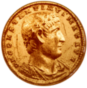
Новац Цара Константина

Кроз капије Ниша су прошли многи значајни владари Европе. 1096. године крсташки витез Валтер, а 1189. године дуже време је у Нишу боравио цар Фридрих I Барбароса кога је свечано дочекао и поздравио велики српски кнез Стефан Немања и са њим склопио савез против Византије.