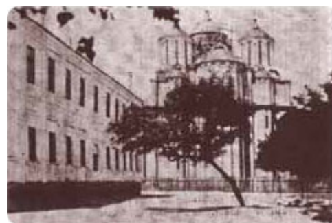
Зграда ОШ Учитељ Таса, прво заседање Скупштине Србије

У Нишу је од 1878. године седиште црквене власти – Митрополије и Епархије нишке. На челу нишке Митрополије стајао је митрополит Виктор. Црква Св. Пантелејмона завршена је 08.08.1878. године. Саграђена је на месту где је око 1185. године оснивач династије Немањића подигао манастир.