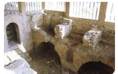
Ранохришћанска базилика 4.век

Град је добио име од реке Нишаве која кроз њега протиче и коју су келтски прастановници звали Navissos. Сваки освајач је давао своје име граду. Римски Naissus, византијски Nysos, словенски Ниш, немачки Nissa.