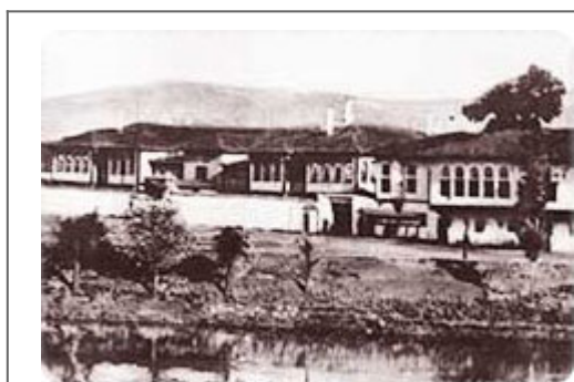
Краљев двор у Нишу

“Краљев двор” у Нишу је био удобна резиденција муслиманских великопоседника. Саградио га је Хафис-паша, а затим је припао Мехмед-паши. Када се 1878. године у њега уселио Главни штаб српске војске, он је био Бећир-пашина својина. Конак је потом пропао, јер унук Хафис-паше није хтео да га прода краљу Милану. Али, његов син Муста-бег га продаје после очеве смрти. Здање је доведено у ред и представљало је пријатну резиденцију краља са погледом на Нишаву и Тврђаву. Зграда је била спратна. Горњи спрат је био за становање са дивним доклатима са којих се краљ Милан обраћао неколико пута народу. Краљица Наталија и престолонаследник Александар су радо боравили у двору.