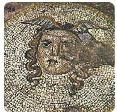
Медијана - мозаик

Цариграда, Сингидунума (Београда). У античко време Naissus је био веома снажан и неосвојив каструм. Због свог изврсног географског положаја Naissus је постао значајна стратегијска тачка тако да се Ниш помиње у свим војним походима на Балкану још од другог века. Код Ниша је Клаудије II победио Готе 269. године и спасио Рим велике опасности. Константин Велики, римски император (306-337), наследник Деоклецијана, је Naissus, у коме је рођен 274. године, украсио раскошним грађевинама (Медијана) и учинио га значајним економским, војним и административним центром.