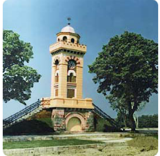
Споменик на Чегру

Прво обележје места на коме је била Чегарска битка подигнуто је 4. јула 1878. године са натписом: “Војводи Стевану Синђелићу и његовим неумрлим јунацима, који овде славно изгибоше 19. маја 1809. године нападајући Ниш. Књаз Милан М. Обреновић IV и његова храбра војска покајаше их 29. децембра 1877. године освојивши Ниш.” Данашњи споменик у облику куле – симбола војног утврђења – подигнут је поводом педесетогодишњице ослобођења Ниша од Турака 1. јуна 1927. године. У полукружној ниши споменика на Чегру постављено је 1938. године бронзано попрсије Стевана Синђелића.