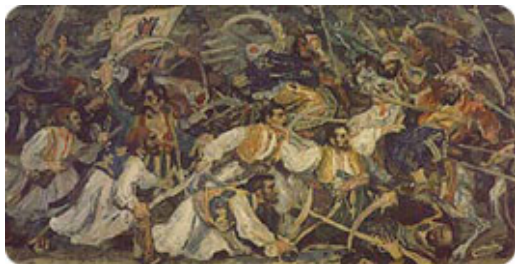
Бој на Чегру

На почетку 19. века најбитнији циљ у обнови српске државе било је ослобођење Ниша од Турака. Српски вођа Карађорђе, је у разговорима са изаслаником царске Русије и даље у преговорима са Наполеоном и турцима, истицао да у састав Србије мора ући и Ниш. Српска устаничка војска је кренула ка Нишу, са циљем да га заузме и продре ка Старој Србији и Косову. Карађорђе је предлагао да на Ниш крене целокупна војска, док су остали команданти захтевали напад на четири фроната, што је било и прихваћено. Српска устаничка војска, са 16.000 бораца, предвођена главним командантом Милојем Петровићем, пристигла је 27. априла 1809. године на домак Ниша, код села Каменице, Горњег и Доњег Матејевца. Српски војници су изградили шест шанчева. Први и највећи је био на Чегру са војводом Стеваном Синђелићем, други у Горњем Матејевцу (код данас обновљене Латинске цркве) са Петром Добрњцем, трећи северозападно од Каменице са војводом Илијом Барјактаревићем, четврти у Каменици са главним командантом Милојем Петровићем, пети шанац је био изнад Каменице са војводом Пауљом Матејићем и шести у Доњем Матејевцу. Захтев Милоја Петровића да се Ниш одмах нападне није прихваћен. Тражило се да се сачека са нападом и изврши јака блокада града. Са друге стране, турска војска је добила велико појачање од преко 20.000 војника из Једрена, Солуна, Врања и Лесковца.